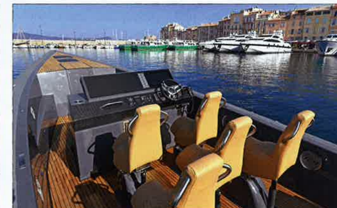
Tous à la même enseigne : les passagers comme le pilote bénéficient d'un siège jockey Ulmann Patrol à suspension. Confort garanti !